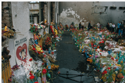
Беслан, сентябрь 2004 г.