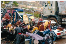
Айн-Аля, Ливан, 13 февраля 2007 г. Взрыв в христианском квартале

Лишенные поддержки иностранных государств и их спецслужб, террористы не смогут продолжать свою деятельность в прежнем объеме.