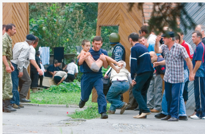
Беслан, сентябрь 2004 г.

Никто, к сожалению, не защищен от ситуации, когда может оказаться в заложниках у террористов