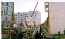
Каспийск, 16 ноября 1996 г.