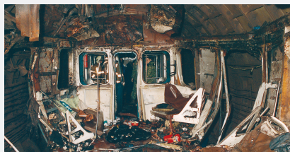
Москва, метро «Автозаводская», 6 февраля 2004 г.

Примеры: «Аль-Каида», движение «Талибан» (Афганистан), «Братия-мусульмане» (Египет), «Абу-Сайф» (Филиппины), «Ансар аль-Ислам» (Ирак), «Асбат аль-Ансар», «Хизб ут-Тахрир аль-Ислами» (Ливан), «Аум Синрике» (Япония) и другие.