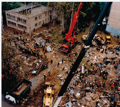
Москва, Каширское шоссе, 13 сентября 1999 г.

Департамент по борьбе с организованной преступностью и терроризмом МВД России (495) 604-88-15