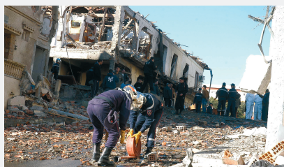
Тения, Алжир, 29 января 2008 г.

Осуществляется организациям этносепаратистской направленности с целью ликвидации экономического и политического диктата интонационных государств (например, «Ирландская республиканская армия» (Северная Ирландия), «Рабочая партия Курдистана» (Турция), «Батасуна», «ЭТА» (Испания), «Фронт национального освобождения Корсии» (Франция), «Фронт освобождения Квебека» (Канада), «Вооруженные силы национального освобождения» (Пуэрто-Рико, США), «Тигры освобождения Тамил Илама» (Шри-Ланка), «УНИТА» (Ангола) и др.).