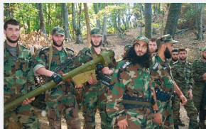
Чеченская Республика, 9 июня 2002 г. Представитель «Аль-Каиды» Абу аль-Валид – уничтожен