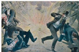
Анише, Франция. 1895 г. Терракт анархиста

В XXI в. просматривается тенденция к расширению масштабов и географии террористической деятельности. Увеличивается число террористических актов, совершаемых с целью личного обогащения. Растет число террористических актов на почве политического противоборства различных сил, а также на почве межэтнических и межконфессиональных противоречий.