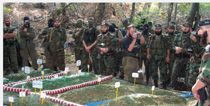
Чеченская Республика, 6 сентября 2002 г.

Субъектами политического терроризма, как правило, выступают радикальные политические партии, отдельные группировки внутри партий или общественных объединений, экстремистские организации, отрицающие легальные формы политической борьбы и делающие ставку на силовое давление (например, «Красные бригады» (Италия), «Фрэнция красной армии» (Бразилия), «Аксон директ» (Франция), «Японская красная армия» (Япония), «осаждоны смерти» в Латинской Америке и др.).