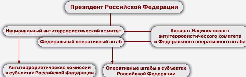
Схема координации противодействия терроризму в Российской Федерации

Важнейшим инструментом антитеррористической политики является осведомленность, то есть знание и готовность к действиям в чрезвычайной ситуации