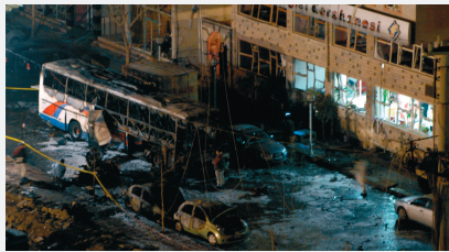
Диябакир, Турция, 1 марта 2008 г.

Кибертерроризм представляет серьезную угрозу для человечества, сравнимую с ядерным, бактериологическим и химическим оружием, причем степень этой угрозы в силу своей новизны до конца еще не осознана и не изучена.