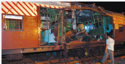
Мумбаи, Индия, 11 июля 2006 г.

Политическая организация, взявшая на вооружение террористические методы борьбы, со временем перерождается в преступную группировку, прикрывающуюся политическими лозунгами.