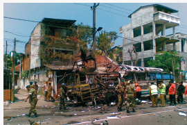
Коломбо, Шри-Ланка, 23 февраля 2008 г.