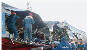
Ессентуки, 5 декабря 2003 г.