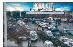
Москва, Дубровка, 25 октября 2002 г.