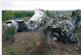
Ростовская область, 24 августа 2004 г. Теракт на борту Ту-154 – место падения

Российская Федерация активно поддерживает усилия мирового сообщества по борьбе с международным терроризмом